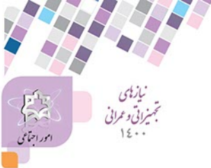
داده جدول صفحه قبل